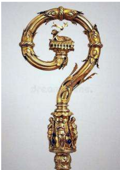
Crosse épiscopale d'illustration

Suite à cette rencontre enrichissante avec Monseigneur Joly, les élèves ont été intéressés, calmes, ils ont trouvé l'évêque sympathique, bienveillant et il a répondu chaleureusement aux questions posées par les académiciens.