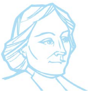
Saint Jean Baptiste de la Salle